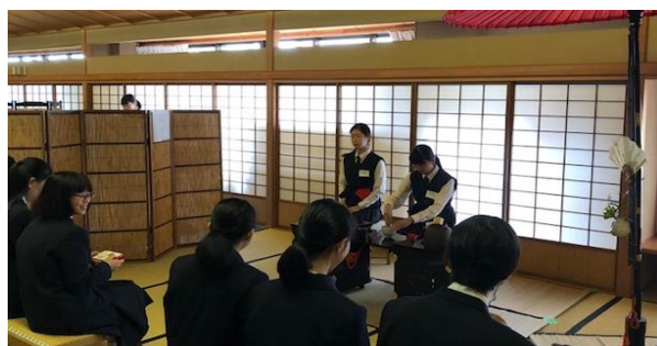
【緊張しながらのお手前です】

生徒の感想から…「他校の生徒や先生方の前でお手前するのは初めてで、とても緊張しましたが、これまでのお稽古で教えていただいたアドバイスを思い出しながら、手順を間違えずにできて良かったです。」「貴重なお道具やすばらしい茶室を見せていただき新鮮な経験となりました。」