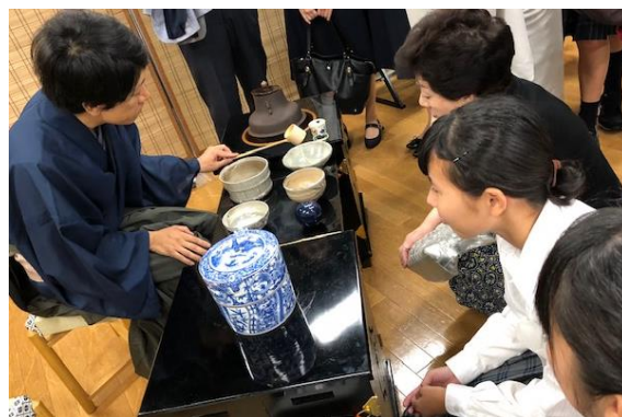
【お道具拝見】 真剣なまなざし！