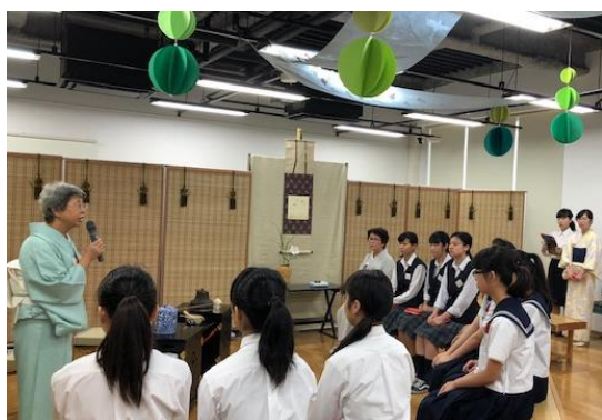
【まずは念入りに 打ち合わせ】