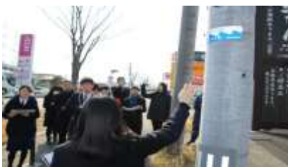
本校設置の波高表示板の案内