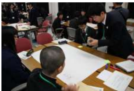
ワークショップの様子。本校生徒はファシリテーターとして活躍しました!