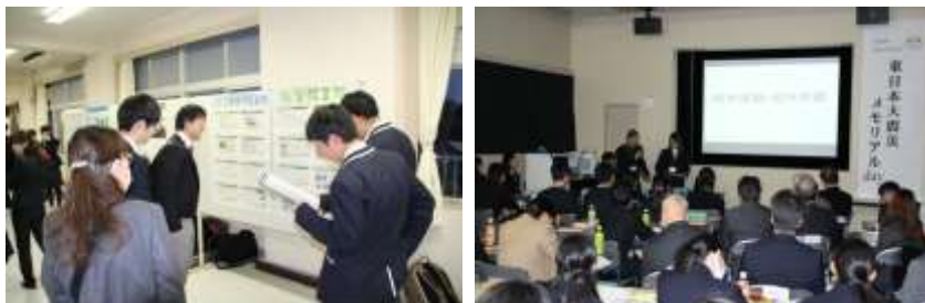
ポスター発表、口頭発表の様子

て高校生に期待すること」の基調講演がありました。災害を数値化する自然科学的なアプローチと、地域を学ぶことが防災・減災につながるといった社会科学的なアプローチ両面の話をいただき、まさに防災・減災は文理融合型のアプローチが必要であることが話がありました。